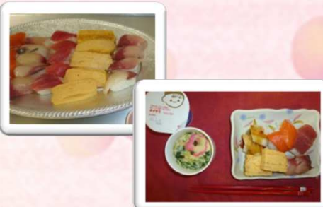
まぐろ、サーモン、はまち、穴子、玉子、茶わん蒸し、ヨーグルト